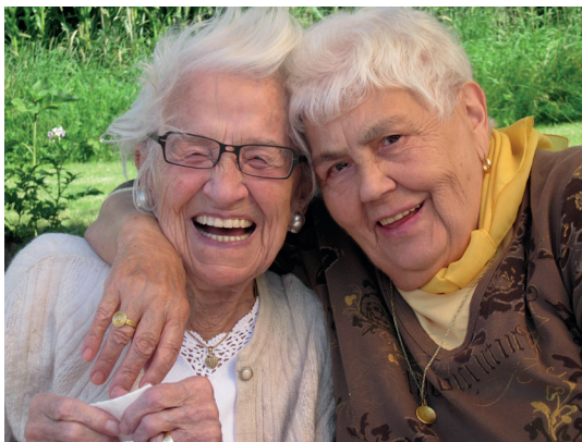
Besuche schaffen auf beiden Seiten große Freude

Ein häufig ausgewählter Aufgabenbereich von freiwilligen, engagierten Menschen im Wohn- und Pflegeheim Haus St. Martin ist der Besuchsdienst .